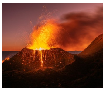
Le Piton de la Fournaise en activité

Donc pour le moment, il se sent très bien à La Réunion et il ne se voit pas repartir tout de suite. Après ça, il verra où le vent le mènera.