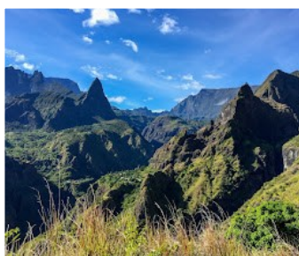
Le cirque de Mafate